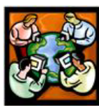
e-services authentication (cross-border)